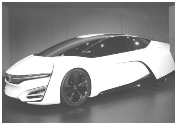
Рисунок 4 – Такой футуристический автомобиль на топливных элементах Хонда собирается запустить в серийное производство в 2015 году

Существующие и разрабатываемые автомобили на топливных элементах позволяют с уверенностью прогнозировать быстрое развитие данных технологий уже в ближайшем будущем, что