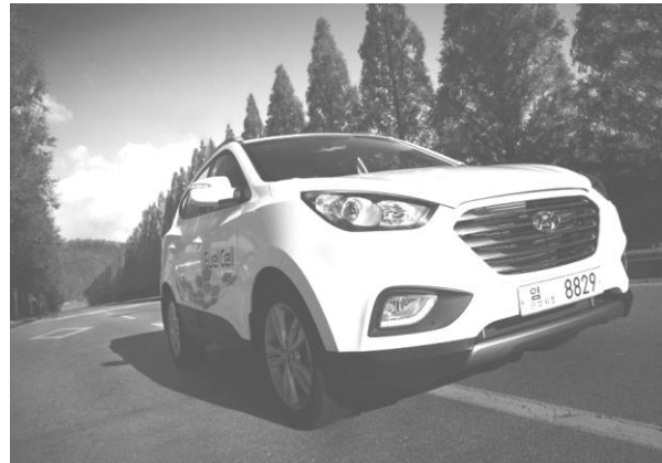
Рисунок 1 – Хюндай планирует в 2015 году произвести 1000 таких автомобилей на топливных элементах

Одновременно увеличилось давление государства на предприятия промышленности в вопросах экологии. Например, в Калифорнии минимум 10% от проданных автомобилей должны быть с нулевым количеством вредных выбросов в окружающую среду. Да и сами концерны стараются снижать вредное влияние автомобилей на окружающую среду: Большинство автоконцернов поставило себе задачу, с 2012 до 2020 года снизить выбросы CO 2 на 30% [1].