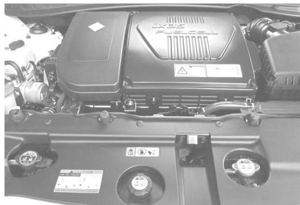
Рисунок 2 – Топливный элемент подает ток на литийно-полимерный аккумулятор, затем ток подается на электродвигатель в 136 лошадиных сил

Ток, вырабатываемый топливным элементом такого автомобиля, подается сначала на литийно-полимерный аккумулятор, а затем на электродвигатель в 136 лошадиных сил (см. рисунок 2).